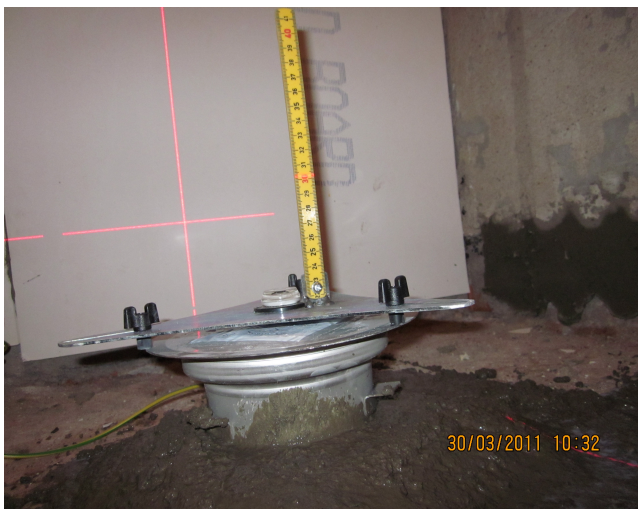
Bild 3 Skyddslocket sitter kvar.

Inom byggbranschen finns det ett talesätt som lyder, `` brunnen hamnar alltid på högsta punkten ``. Man tror kanske att detta talesätt är ett skämt men så är inte fallet. Det händer förvånansvärt ofta att brunnen hamnar på fel höjd, t ex i ett badrum.